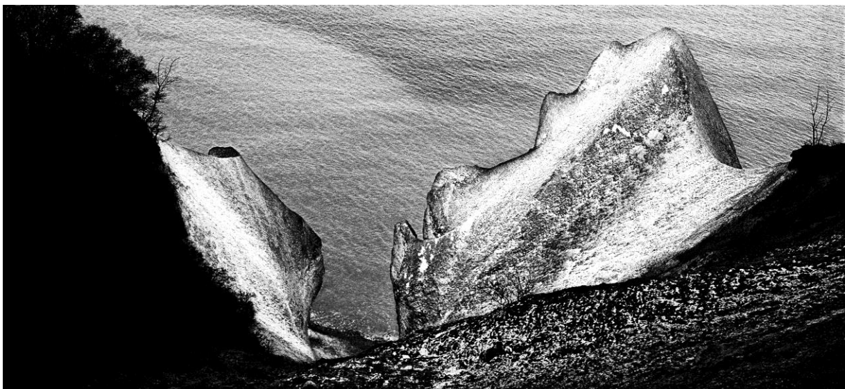
Wissower Klinken

Vor 60 Jahren begann der Stralsunder Fotokünstler Volkmar Herre die Insel Rügen für sich zu entdecken und bedient sich heute vor allem der Camera obscura. Die dargebotene Bildsequenz aus einer Schaffensphase zwischen 1975 und 1985 spiegelt noch in klassischer Weise die Vielfalt rügischer Landschaft in ihren Formationen und Lichtstimmungen als „Unendliche Landschaft“ wider. Die Projektionen werden mit Musik von Brahms unterlegt.