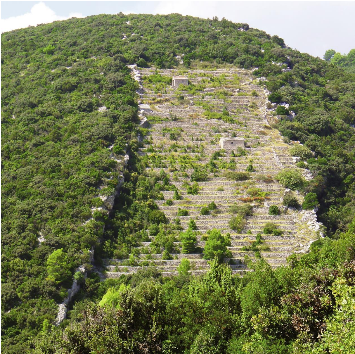
Rebberg auf Korčula, Foto: Peter Degen

Mit dem Bau von Terrassen macht der Mensch sich Landschaften nutzbar, die vom Relief, vom Wasserhaushalt oder von der Höhenlage her ansonsten für die Landwirtschaft nicht geeignet sind. Terrassen stellen die aufwändigste wie kunstvollste Überformung eines Geländes dar. Die Bauwerke setzen eine Festigkeit voraus, die auch zu ihrer langen Lebensdauer beiträgt. Die kleine Promenade über die Terrassen unseres Planeten soll die innovatorische Kraft und den Reichtum der geschaffenen Muster aufzeigen.