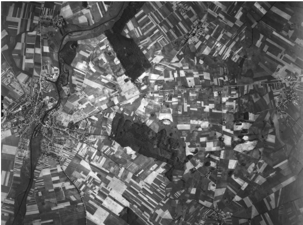
Weg von Lübz nach Benzin, Luftbild 1953

Wege sind Teil der historischen Entwicklung einer Region, sie sind mit der Landschaft und deren Nutzung verbunden. Ein wiederholtes Benutzen zum Gehen von A nach B, das Erreichen der Arbeitsstätte oder auch das Erschließen und Durchqueren erhält Wege und gibt ihnen ihre Legitimation. Der Gebrauchswert, der somit durch die Verwendung eines Weges entsteht, ist durch Zweck und Absicht bestimmt. Aufbau, Zonierung, Dimensionierung und Ausstattung eines Weges ergeben sich also durch dessen Gebrauch. Schon bei der Bezeichnung von Wegen wird ihre Funktion oft klar. Während Begriffe wie Fuß- oder Fahrwege erklären, wie wir sie benutzen, lassen Wald- oder Landwege die Nutzung ihrer Ränder erkennen. Auch der Weg von Lübz nach Benzin in Mecklenburg besteht aus mehreren durch ihre Landnutzung und Funktion zu unterscheidenden Teilen. Die Entstehung und die derzeitige Situation dieser Teile sind abhängig von der Geschichte, der durch Menschen geformten Landschaft, in der sie sich heute befinden.