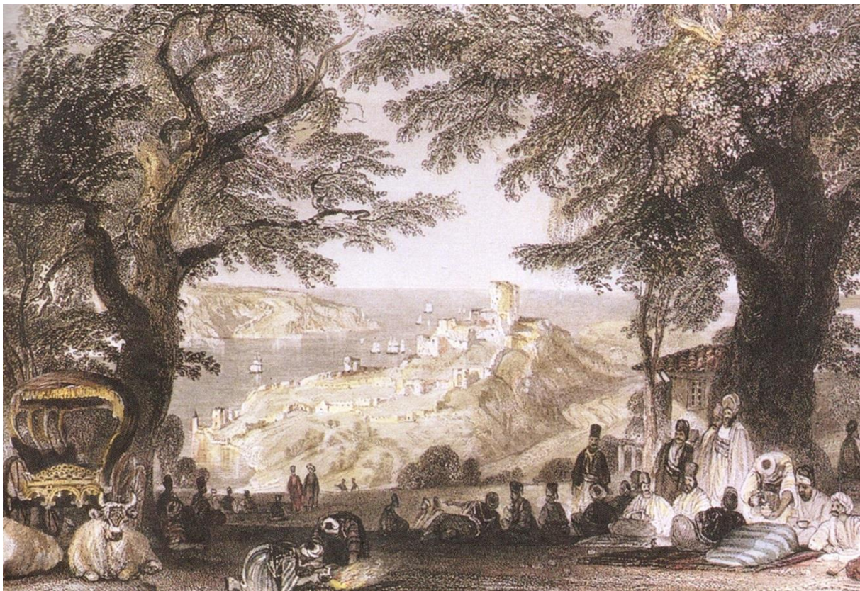
Blick auf die Mündung des Bosphorus in das Schwarze Meer, Quelle: Aktas, Ugur, 100 Gärten von Istanbul. Istanbul 2010. S. 149

Aus dem Zulassen von Schönheit, Tagträumen und Zeitlosigkeit leiteten die Osmanen wohl auch ihre Gestaltungsansprüche an Garten und Umwelt ab. Das Goldene Horn, das Schwarze Meer, das Marmarameer und vor allem der Bosphorus schaffen dazu einen unvergleichlichen, landschaftlichen Rahmen. Die türkische Kultur hat auf ihrem langen Weg nach Westen Versatzstücke aus vielen Kulturen, so auch Aspekte der Gartenkultur und Gartengestaltung, aufgegriffen und mitgenommen. Mit der Eroberung von Byzanz im Jahr 1453 durch die Osmanen sind die Wanderungsbewegungen zu einem Ende gekommen. Die uralte Stadt am Bosphorus wurde für die neuen Herrscher zur Residenz. Wie ein ehemals nomadisierendes Volk Umwelt und Natur, Garten und Landschaft rund um den Bosphorus gestalterisch adaptiert und beeinflusst hat, wird das Thema dieses Vortrages sein.