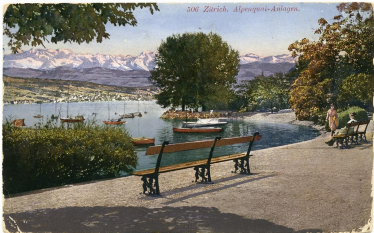
Zürich, Alpenquai-Anlagen, 1934, Paul Bender

1887 eingeweiht, gehören die Promenaden und Parkanlagen heute zu den wichtigsten Gartendenkmälern der Stadt. Trotz hervorragenden Pflegekräften und genügend Finanzmittel stehen wir vor großen Herausforderungen, denn der natürliche Alterungsprozess paart sich mit der Übernutzung und den drohenden Verschiebungen der Pflanzenszusammensetzungen durch Klimawandel und Krankheiten.