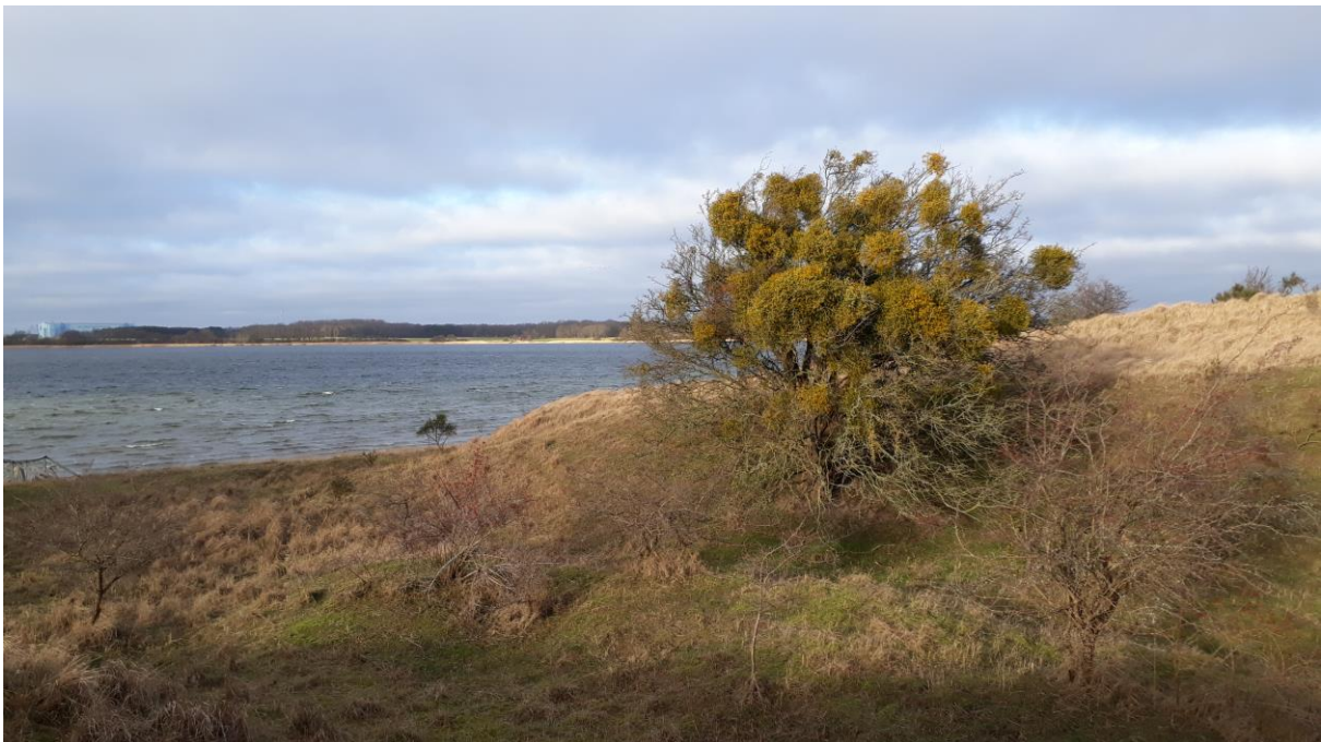
Halbinsel Devin

Auf der seit 1993 unter Naturschutz stehenden Halbinsel Devin lebt in einer waldfreien Moränenlandschaft und in den Feuchtbiotopen eine reiche Flora, wovon einige Arten auf der Roten Liste Mecklenburg-Vorpommerns stehen. Die Vielfalt der Landschaftsformen und Biotoptypen wie Birkenmoor, Orchideenwiese sowie Trocken- und Magerrasen bietet auch der Tierwelt mannigfachen Lebensraum. Auf einem Gang durch die Natur sind wir plötzlich berührt von der Schönheit der Landschaft oder einer Blume. Dies kann der Anfang einer wirklichen Begegnung sein, wenn wir nicht gewohnheitsmäßig weiterreilen, sondern diese Erfahrung vertiefen. Liebevoll beobachtend und das Erlebte innerlich nachschaffend entwickeln sich schrittweise ein Dialog und eine Verbindung mit der Natur des Ortes. Im Austausch mit anderen bemerken wir, wie jeder seine eigene Blickrichtung hat. Jedoch ergänzen sich die verschiedenen äußeren und inneren Erfahrungen zu einem umfassenden Gesamtbild des Charakters der Landschaft. Mit einer Wanderung über die sanften Hügel der Trocken- und Magerrasengemeinschaften und durch die mit Moorvegetation besiedelten Senken der Halbinsel Devin klingt das Symposium aus.