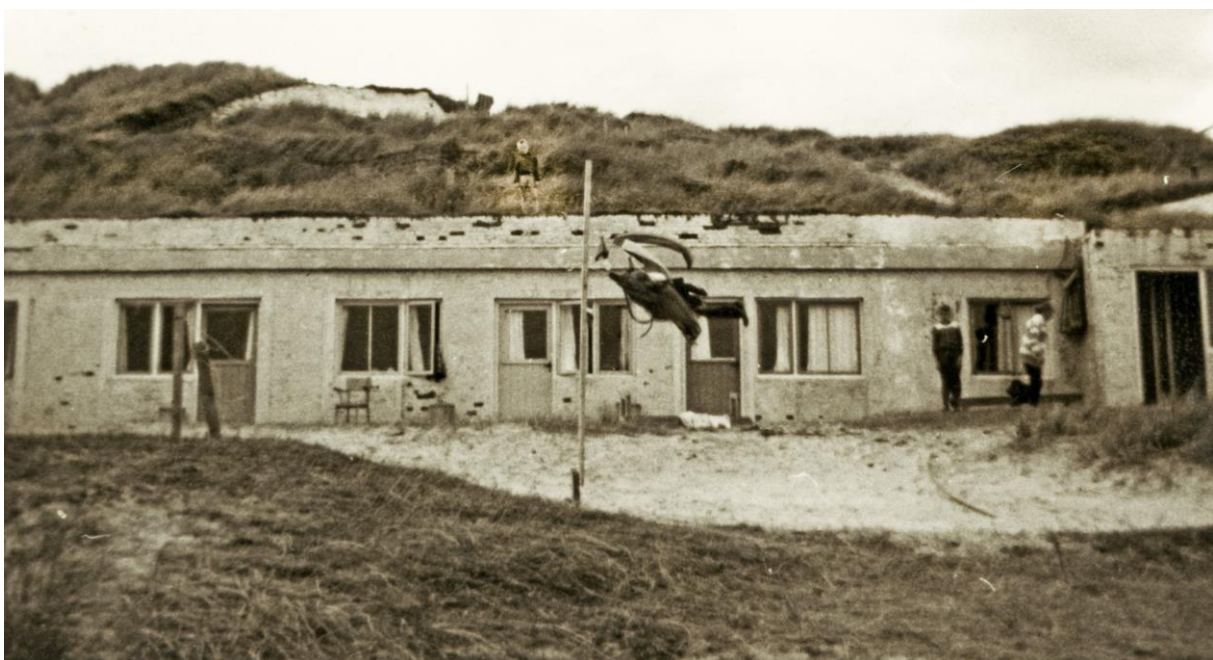
Mannschaftsunterkünfte Terschelling