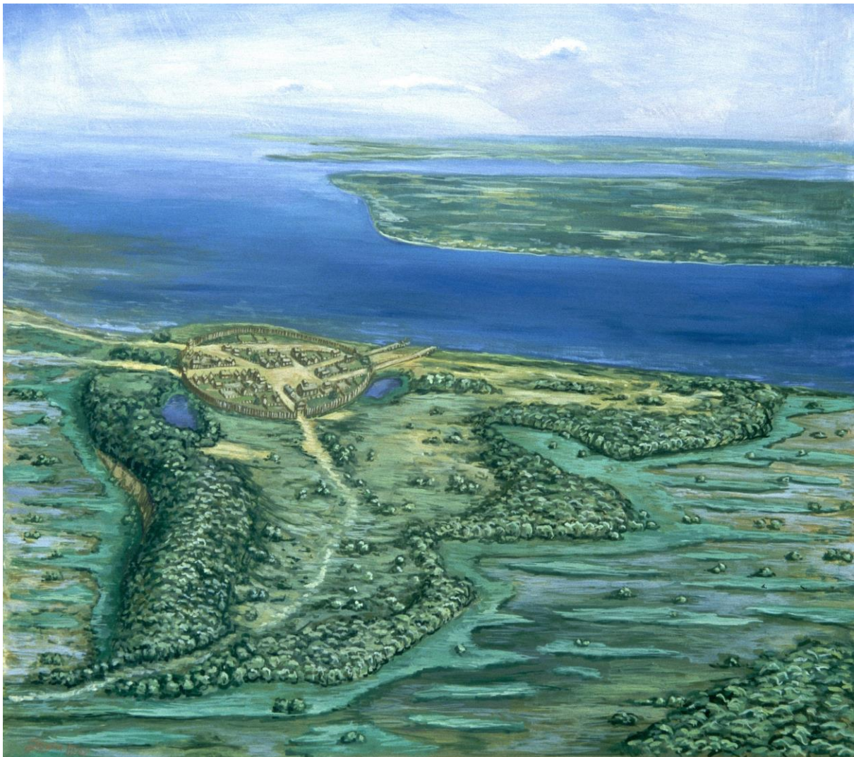
Stralsund um 1250, Rekonstruktionszeichnung von Jörg Matuschat (Detail)

In den zurückliegenden fast dreißig Jahren Stralsunder Stadtarchäologie sind eine Vielfalt an Funden und Befunden zu Tage gekommen, die zu neuen Schlussfolgerungen in der Stadtgeschichte führten. Darunter befinden sich auch Erkenntnisse über die naturräumliche Ausgangslage zu Beginn der dauerhaften Besiedlung der Stralsunder Altstadt und ihres Umfelds um 1234. Das heutige Landschaftsbild ist das Ergebnis von zum Teil schon sehr frühen kulturland-schaftlichen Veränderungen, die die neuen Siedler mit teilweise massiven, prägenden Eingriffen in ihre Umwelt bewirkten. Manche dieser anthropogenen Eingriffe sind auf den ersten Blick nicht sofort als solche zu erkennen und sollen in Wort und Bild erläutert werden.