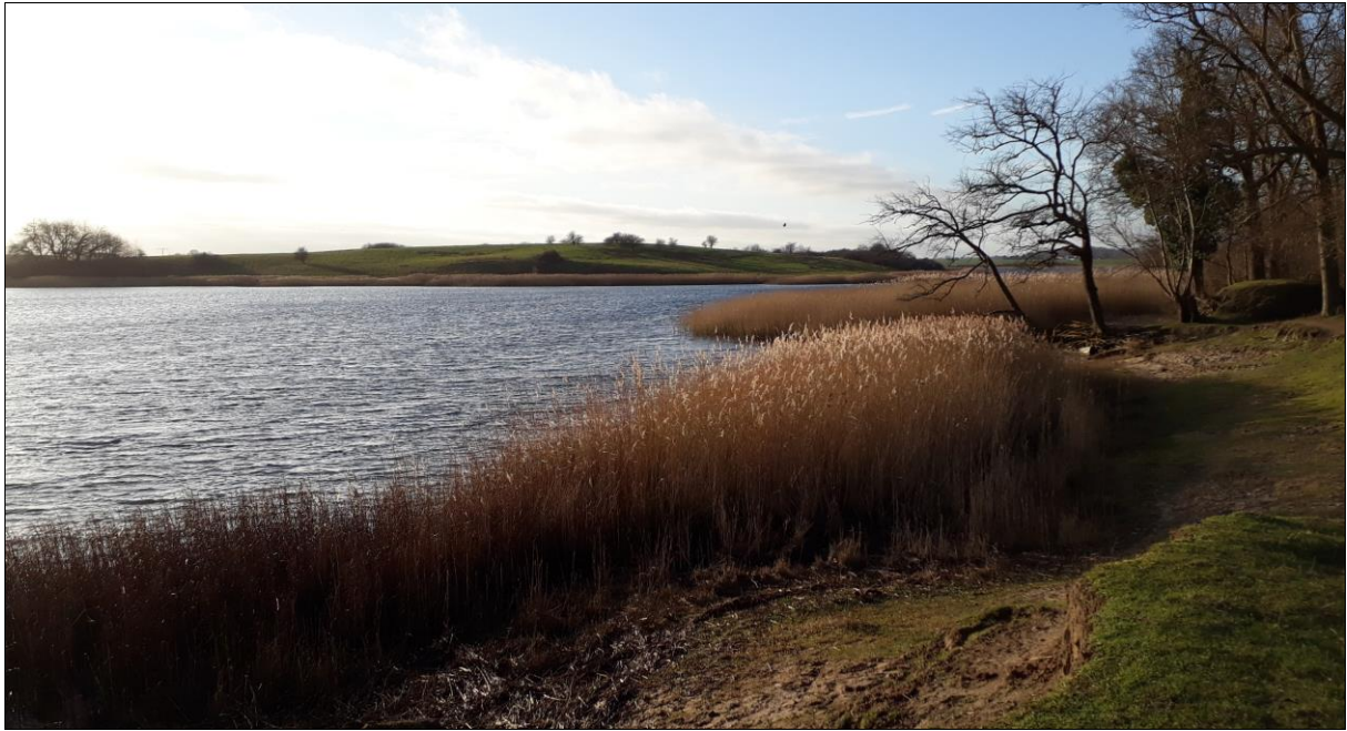
Halbinsel Devin