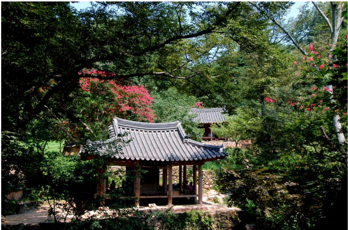
Gelehrtengarten Sosewon

Im frühen 16. Jahrhundert hat sich in Korea ein Gartentypus herausgebildet, der sich als „Exilgarten des Gelehrten“ umschreiben lässt. Politisch motiviert, die taoistische Idealvorstellung einer Landschaft als Vorbild nehmend, war der Exilgarten aber geistig dem Neokonfuzianismus geschuldet. Die in Ungnade gefallenen Dichter, Gelehrten und Philosophen errichteten in den tiefsten bewaldeten Bergen bescheidene Gärten, bildeten miteinander ein regionales Netzwerk, aus dem bald mehrere Dichterschulen entstanden. Seitdem ist der Garten in Korea mit der Dichtkunst und konfuzianistischen Weltanschauung unzertrennlich verwoben. Der Exilgarten nimmt in der koreanischen Gartenkunstgeschichte eine dominierende Stellung ein und zeigt bleibende Einflüsse, die heute noch sehr lebendig sind.