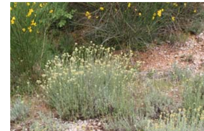
Helichrysum it.

MONASTERO DI FONTE AVELLANA, SERRA SANT'ABBONDIO (PU)