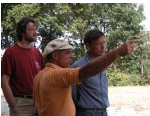
Corso sul paesaggio 2008

Ha sede in Germania e Paesi Bassi, opera in diversi stati europei tra cui l'Italia. Si basa sulla Convenzione Europea del Paesaggio del Consiglio Europeo (ratificata in Italia). PETRARCA Organizza corsi e seminari in vari paesi d'Europa ( www.petrarca.info ) proponendo strumenti di conoscenza innovativi e creativi. Le piante medicinali e il loro rapporto con l'uomo e il paesaggio rappresentano un importante ambito di attività dell'Accademia.